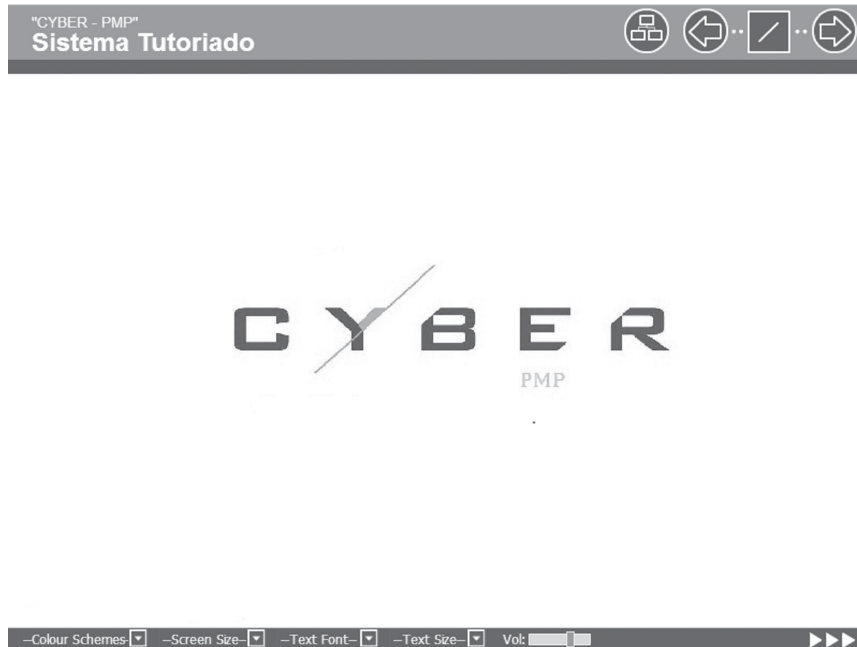
FIGURA 1. Interfaz inicial “Cyber-PMP”

En la figura 3 se presenta la primera actividad propuesta por el sistema perteneciente al primer grupo de conocimientos (procesos de iniciación) y a la primera área de conocimiento (gestión de la integración del proyecto).