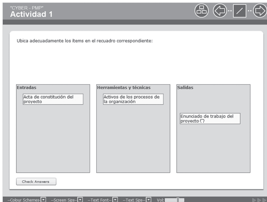
FIGURA 3. Actividad 1 “Cyber-PMP”