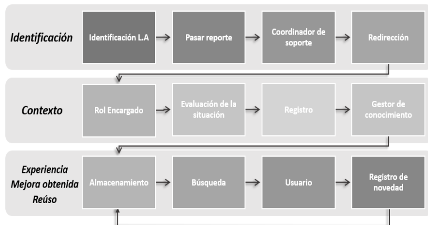
Figura 2. Proceso de gestión de las LAs.