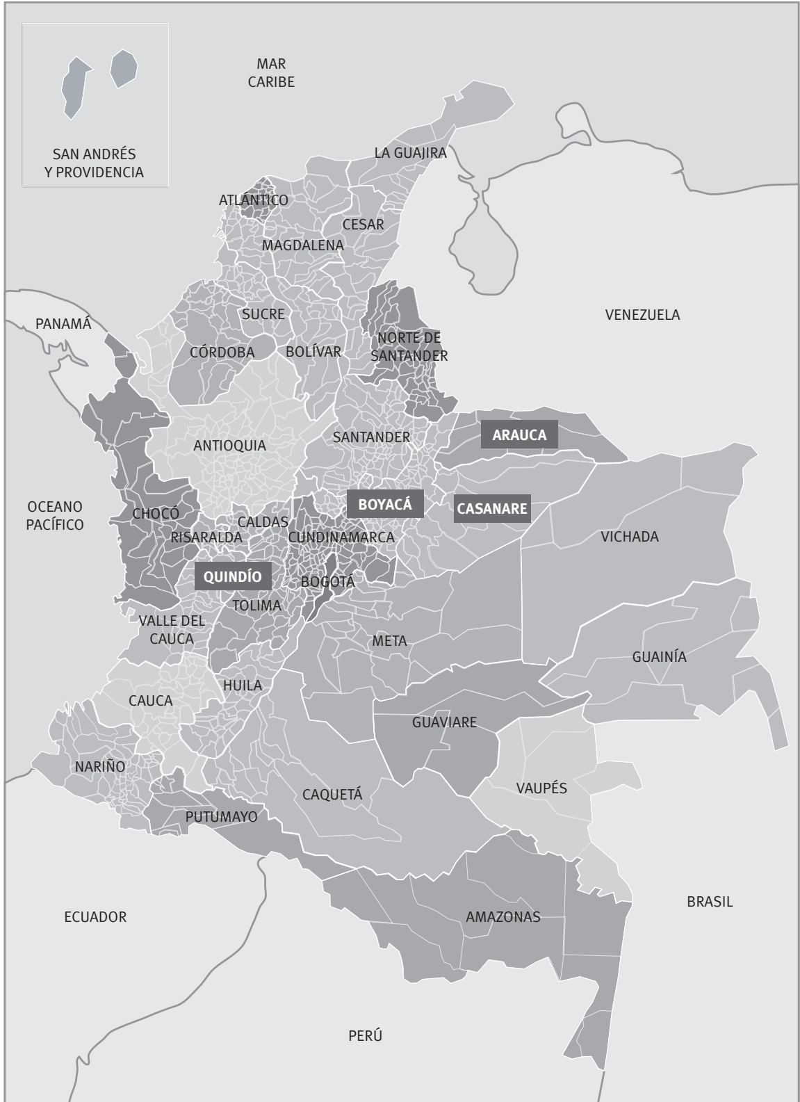
FIGURA 1. Posición geográfica